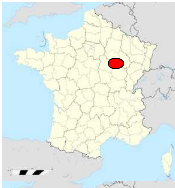
La ville de Semur XXXXXXX